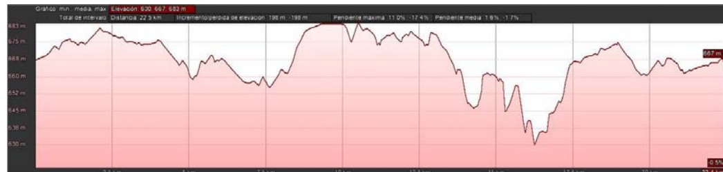
PERFIL DEL RECORRIDO ALTERNATIVO